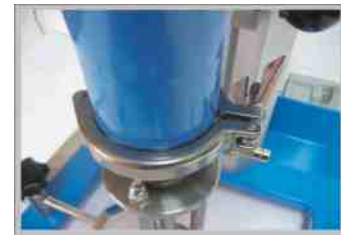
Kosz mlyna montowany jest