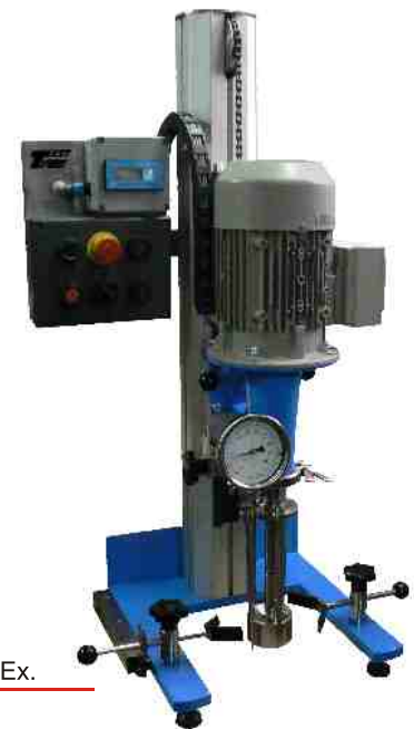
Młyn koszowy MLB w wykonaniu Ex. Baket mill MLB - Ex execution. Мельница корзиной MLB в исполнении Ex.